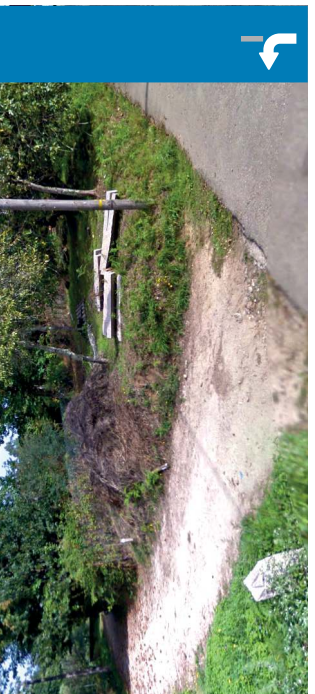
Orbenlle desvío | 8.5 km