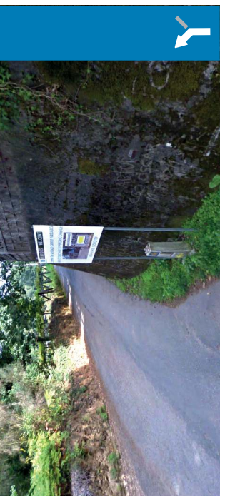
Orbenlle bifurcacion | 8.2 km