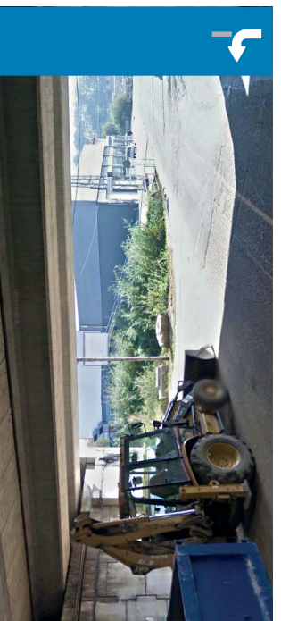
Torneiros Paso inferior A55 | 8.5 km