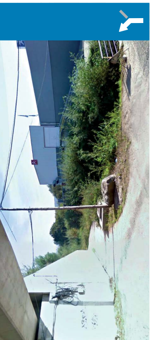
Torneiros Paso inferior A55 | 15 km