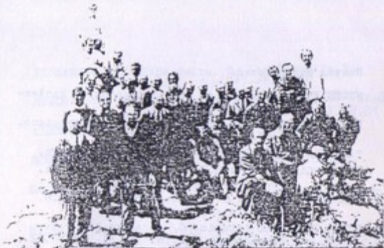
Parte de los miembros asistentes al "I Encuentro Jacobeo"

Las " Asociaciones de Amigos del Camino de Santiago " han constituido una de las conclusiones del "I Encuentro Jacobeo". En aquellas días ya veíamos la urgente necesidad de crear estas Asociaciones en muchas localidades de la Ruta Jacobea.