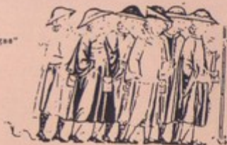
Peregrinos. "Cantigas" Siglo XIII