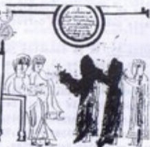
Adoración de los Reyes C. de Santa María X

Para todos estos trabajos, recordamos, una vez más, la urgente necesidad de iniciar la elaboración de buenos y totales inventarios de las fuentes jacobea. Sin este primer paso cualquier estudio general que se pretenda realizar no ofrecerá otra ventaja que la de haber perdido el tiempo.