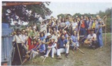
Los participantes en la Semana fueron testigos de la colocación del Hito de Castromaior

El ambiente popular, el factor más interesante, ha sido siempre buen acogedor del peregrino. Ahora hace falta que las autoridades sepan sintonizar con este sentir popular, traduciendo su actuación en realizaciones concretas, sistemáticas y operativas.