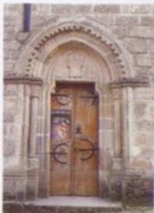
Puerta norte de la Iglesia de San Salvador de Sarria

Antes que en San Salvador de Sarria presidía Cristo,