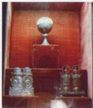
Caliz, patena, relicario y ampones del monasterio eucarístico de O Cebreiro

dejado centenares de obras en las tierras de Lugo. Un buen número de ellas se localizan, precisamente, a lo largo del "Camino de Santiago" o en sus inmediaciones. Entre otras construcciones pertenecientes a este estilo, y que tienen como denominador común una cronología que en ningún caso baja de la segunda mitad del siglo XII, y que en algún caso llega a frisar el 1200 e incluso a rebasarlo, cabe citar las iglesias de Santiago de Triacastela (el ábside solamente), Santiago de Renche (vestigios en la nave y en particular en el muro sur), San Martín del Real (humilde fábrica rural que ha llegado casi completa hasta nosotros), monasterio de Samos (puerta de la antigua construcción que se abre al claustro pequeño), San Esteban de Calvor (con restos en los muros laterales de su nave), Santa María de Ferreiros (interesante puerta principal que sigue el esquema surgido en la del norte de la catedral de Lugo), Santiago de Ligonde (arco triunfal y curioso relieve en el exterior del muro sur de la nave), San Tirso de Palas de Rey (puerta principal y algunos otros restos), San Julián del Camino (interesante y elegante ábside), San Pedro de Pambre