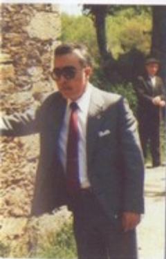
Presidente de la Excma. Diputación de diendo a la colocación de los Hitos no francés

ación van a ritmo lento. El o la obra es de tarda actua- e del "mañana, mañana". A poder concluir esta señali- 1987.