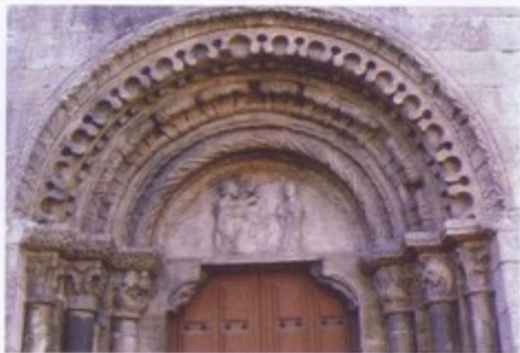
San Juan de Portomarin, arquivolta y timpano de la puerta Norte: Anunciación

La pujanza artística del barroco se deja sentir con diversas obras en un buen número de lugares e iglesias. Su valoración tiene que ser, necesariamente, variada, y en alguna de ellas se detecta el lejano recuerdo de directrices emanadas de los grandes artistas de nuestro barroco, recuérdese, por ejemplo, el bonito retablo de