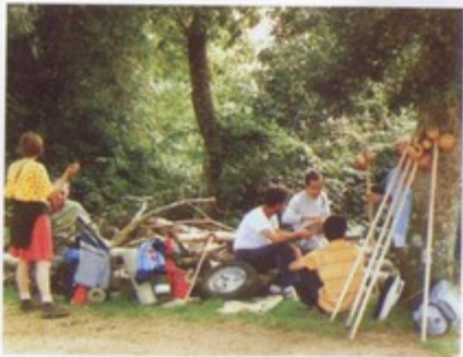
Participantes en la I Semana de Estudios Históricos elaborando las "conclusiones", a pie de camino, durante un breve descanso