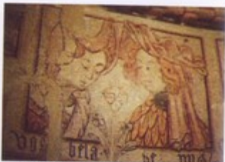
Detalle de las pinturas del ábside de la iglesia de Villar de Donas

A la iglesia de Villar de Donas pertenece una hermosa cruz de plata, de estilo plateresco, más expresiva que las barrocas de Triacastela y de San Cristóbal. La alusión en ella al camino de Santiago y a la orden militar del mismo nombre es visible en una orla de conchas y en una espada (la cruz de Santiago). La espada se destaca de la plata por el dorado que admitió ya en la primera mitad del siglo XVI.