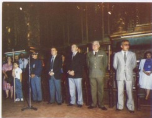
El ilmo. Sr. Presidente de la Diputación de Lugo en compañía de las autoridades Provinciales asistentes al acto de clausura en el altar mayor de la catedral compostelana durante el acto de clausura de la "I Semana de Estudios Históricos"