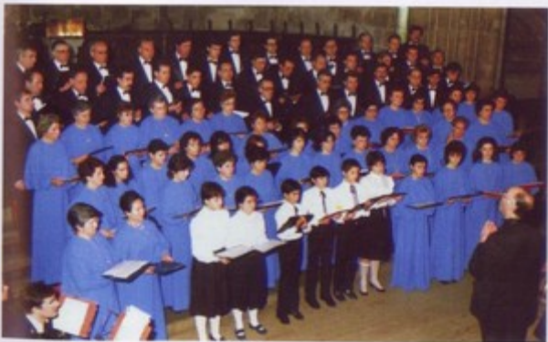
El Orfeón lucense durante el concierto ofrecido en la Real Abadía de Samos