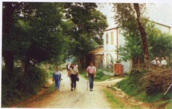
Al borde del magnífico Camino Real, las gentes del lugar contemplan, con comprensivo respeto, el paso de los participantes en la "Semana".

Triacastela, Samos, Sarria, Portomarin y Palas de Rei fueron los finales de las etapas en que se dividió este recorrido por