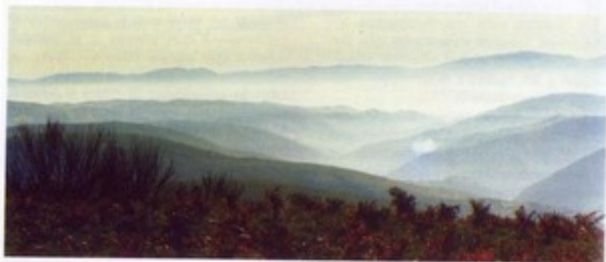
Desde el Monte Cebrero, el "Mons Februari" calixtino, el camino se pierde entre brumas buscando el descanso en Triacastela.