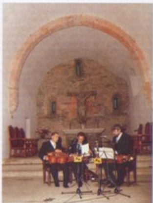
El grupo de Cámara de instrumentos medievales y populares de la Diputación de Lugo en el concierto ofrecido en Santa María la Real de O Cebreiro