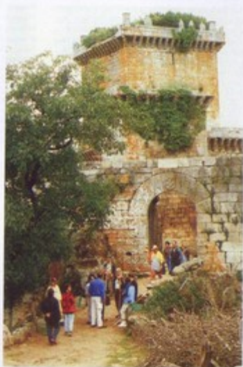
Los participantes en la "I Semana de Estudios Históricos" en el Castillo de Pambre

Curiosamente, los ayuntamientos de la ruta, autoridades y representaciones y el mismo pueblo, salieron al Camino a recibir a estos peregrinos, 51 en total y acompañantes hasta más de una ochentena de personas. Salvo raras excepciones, todos los Alcaldes, miembros corporativos y hasta los mismos secretarios, párrocos, etc. fueron, al final de cada etapa, volcándose en recibimientos, saludos y parabienes que iban calando en los caminantes y tal vez, por el significado, en la propia organización, técnicos, etc. Si era brillante, alegre y animoso por tanto el caminar de estas gentes, estudiosos todos y religiosos algunos, más lo eran los finales de etapa que se hacían en Triacastela, Samos, Sarria, Portomarin y Palas, en los cuales se ofrecían verdaderas lecciones de un alto interés artístico y cultural a cuyo nivel tal vez nunca se había llegado en algunas de las plazas reseñadas. Omitimos nombres de gentes, grupos, técnicos que fueron formando los equipos de trabajo y organización, todavía están en la mente de todos. De ellos se habló en esa jornada de clausura, en Palas de Rei, momentos antes de partir para Compostela, otra gran gestión, cuyo éxito, se logró paralelamente con el caminar.