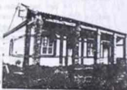
Hospital de Orbigo. Albergue de Peregrinos

ASTORGA . Los "Hermanos Holandeses" prestan muy buena acogida a los peregrinos. Pero hay que pensar en "su Albergue".