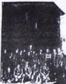
Jóvenes restauradores del Albergue de Castrojeriz

¡Qué el ejemplo de Castrojeriz cunda en otras muchas autoridades locales del itinerario Jacobeo!