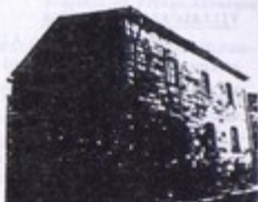
PP. Paules. Casa-albergue de Peregrinos

En esta localidad estaba suscitando problemas el alojamiento de peregrinos. Los PP. Paules, generosamente, ofertan una buena casa para habilitar albergue. Son necesarias obras de acondicionamiento. Confiamos que el Ayuntamiento aproveche esta oportunidad, colaborando eficazmente a resolver el albergue de peregrinos muy necesario en esta localidad.