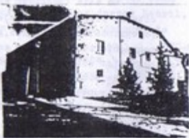
Albergue de Villalcazar de Sigüe

La Diputación Provincial de Palencia bien podría colaborar a restaurar dignamente este buen Albergue de Peregrinos, colaborando con los vecinos de la localidad