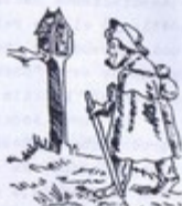
Illustration de M. Pichard - No 270 - 2

En nombre de todos los asistentes españoles expresamos nuestro agradecimiento a la Asociación de París por todas sus atenciones hacia nosotros.