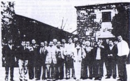
Ayer quedó constituida la "Asociación de Amigos del Camino de Santiago"

Los asistentes a la reunión ante la iglesia de Santa María de la Real, de O Cebreiro