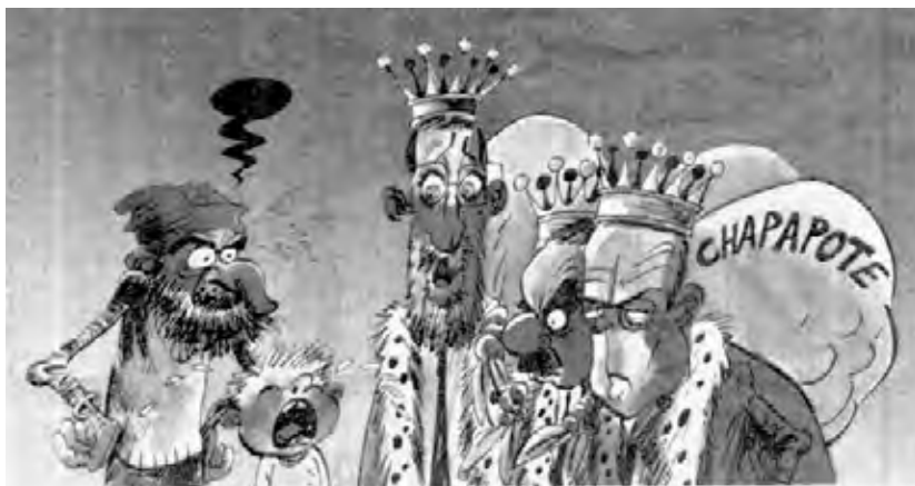
Os Reis Magos do Chapapote, por Abraldes, publicado en La Voz De Galicia .

Dentro del: certa lenda que aventa os trancanís, o estadio dun espello cara ó final do túnel, vinteún anos e un día despezando o volume dun enorme patache de cheminea anil que deixou tras das costas márdeas de negro cuspe.