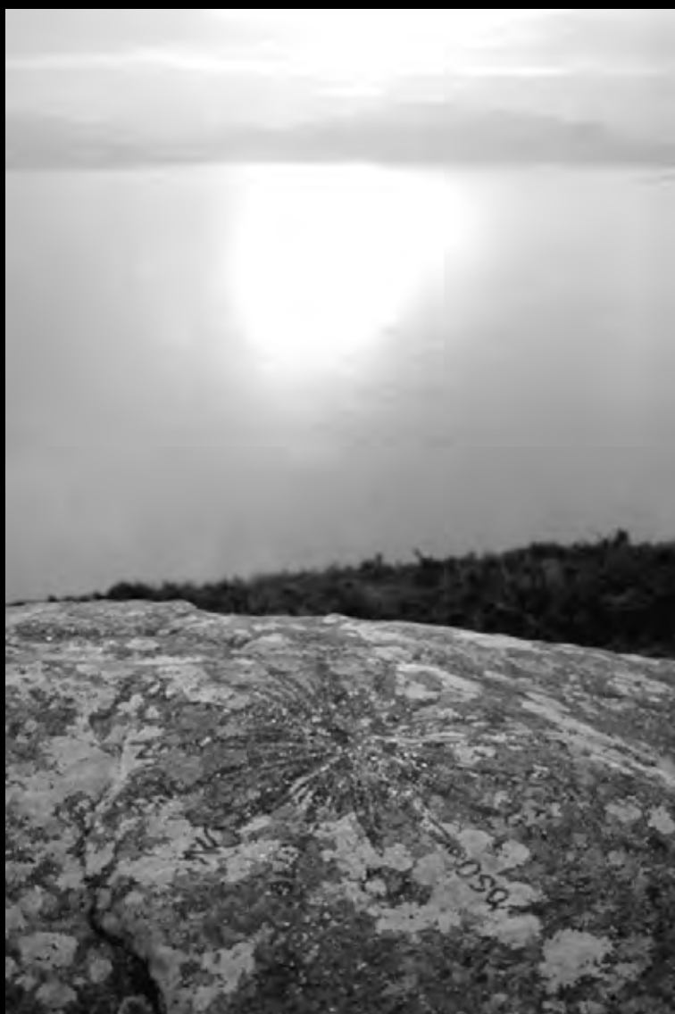
O Mencer dende a ermida de San Guillermo.

Era una visión que, pegado a la televisión vía satélite, surgía todas las veces que aparecían las imágenes de Galicia, duramente azotada por un desastre ecológico, cultural, económico, social, psicológico, sin precedentes. Finisterre=Estrella oscura se daba muy bien a representar la situación. Alegoría no sólo del desastre, sino también de un mundo y de una época oscuras. Casi lúgubre prefiguración de un fin del mundo poblado de blancos y desesperados fantasmas que sólo podía imaginar un director de películas catastróficas.