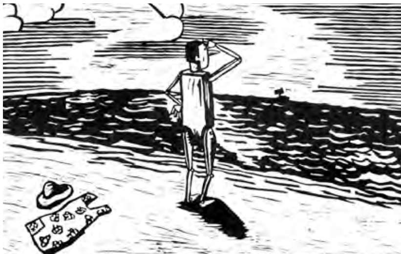
As Aventuras de Pinocchio , debuxo de Federico Fernández, Xerais, 1988, Col. Xabarán de Ouro.

Tragedia del petrolero “Prestige”/02 José Miguel Burgui Ongay