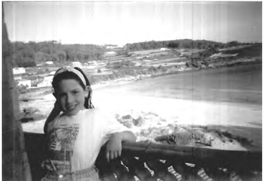
A destinatária coa praia de Estorde ó fondo.

Pero, a pesares dos piratas das compañías petrolíferas e dos políticos incompetentes e mintireiros, prométoche miña filla, que voltaremos a ve-lo solpor ó Cabo, e para que iso sexa posible quero que berres alto e forte, como cando de nena espertabas de noxentos pesadelos en escuras noites de tronada. ¡Berra, miña neniña, berra conmigo, berra con tódolos teus amigos da Costa da Morte, berra con tódolos galegos de boa vontade. ¡NUNCA MÁIS!