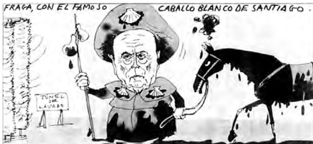
Ilustración realizada por Guillén, publicada por el periódico "La Vanguardia".

-Tampouco eu, fillo, porque aquí mesmo parece que vivimos no mundo ó revés... O peor de todo é que, se cadra, os ananos seguran fãncendo das súas e o patriarca cazando bichos entre tanto as vacas tolean e os percebeos se fan o hara-quiri co bico da unlla. A fin e ó cabo, todos eles non son máis ca monicreques movidos polos fíos dos que en realidade mandan desde as alturas, os señores do petroleo e da guerra,...pero esa xa é outra historia.