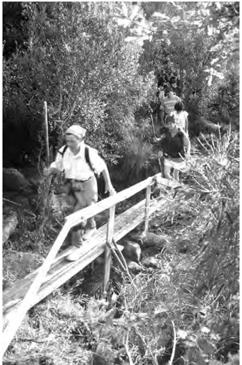
Ponte de Logoso derrubado.