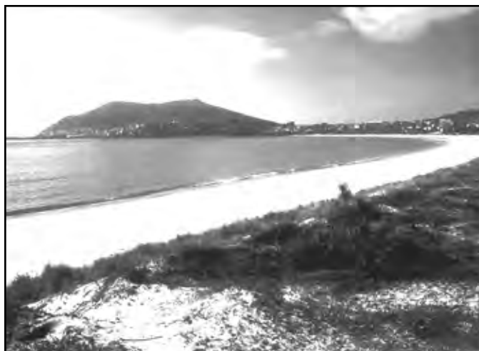
PRAIA DA LANGOSTEIRA E CABO FISTERRA

PROLONGACIÓN XACOBEEA A FISTERRA E MUXÍA.