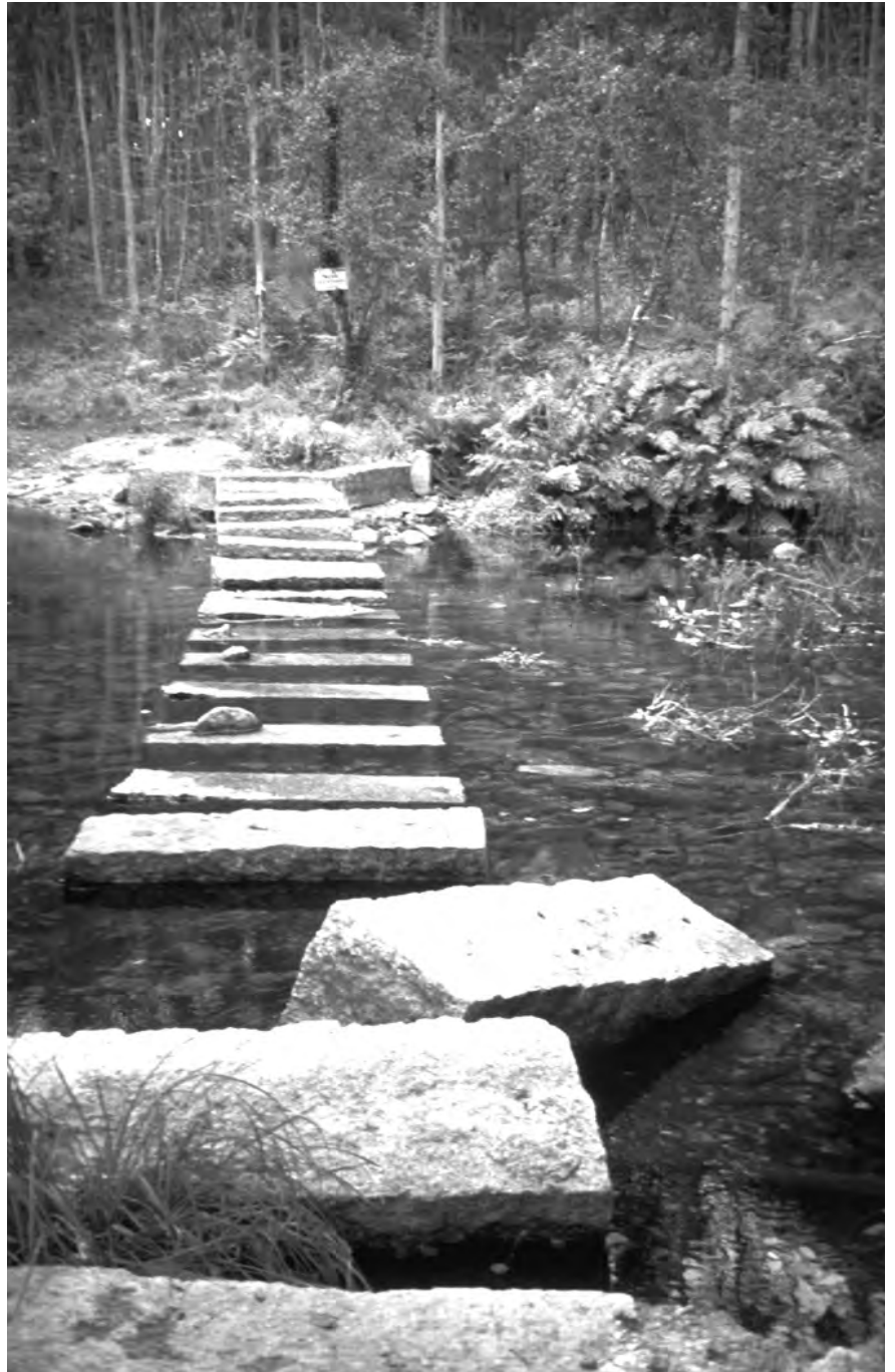
Paso do Vaosilveiro.

Si se consiguiera llevar a cabo la indispensable construcción de puentes o pasos para peregrinos en la Prolongación Jacobea a Fisterra y Muxía y hubiera fondos básicos para ello, acometeríamos la construcción, o rehabilitación, de un nuevo albergue en la Costa da Morte. Para ello ya estamos hablando con todos los alcaldes de la zona para determinar en que punto resultaría más útil (también en función de los locales o terrenos que se puedan conseguir, por cesión o compra). En este sentido vuestra colaboración puede ser doble. Por un lado mediante donativos en la cuenta arriba citada, y por otro mediante el trabajo personal de quién quiera aportar ese “algo más”, o mediante donaciones de equipamiento. Queremos que sea un albergue gratuito, con todos los componentes de la vieja y querida hospitalidad jacobea, y además, hecho con el corazón por todos nosotros. Su función sería, también, la de evocar el gesto solidario de los voluntarios y amigos peregrinos con poemas, frases, dibujos, emblemas, etc.